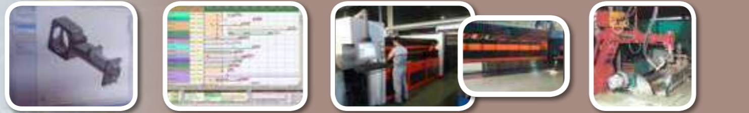
Dessin en 3D 3D design